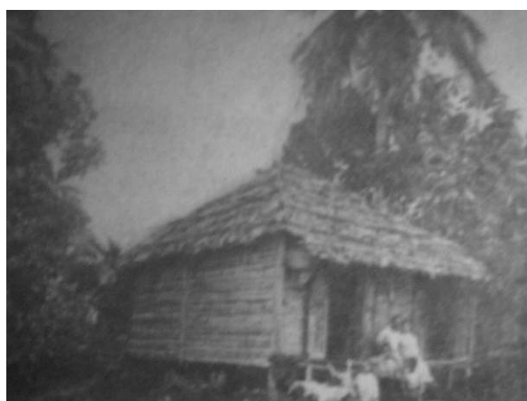
3. “Bohío campesino en Bayamón”

Ya como telón de fondo o al pie de desbordantes vegetaciones que los abrazan y de las cuales asoman como una prolongación o solitarios sobre una geografía casi yerma (imagen 3), los bohíos ganan protagonismo sobre otras edificaciones del interior isleño y apuntalan aquella óptica interesada en validarse como alternativa de un futuro promisorio. Aunque prescindan de descripciones complementarias, las fotografías hilvanan las pretensiones de la mentalidad conquistadora que regula la distancia relativa de los elementos en la escena. El ajuste del campo de la visión que coloca los bohíos en primer plano no sólo convierte las imágenes en correlatos visuales de la asfixia, la oscuridad y la estrechez verbalizadas con recurrencia; 10 también documenta su fragilidad y activa su condición desechable.