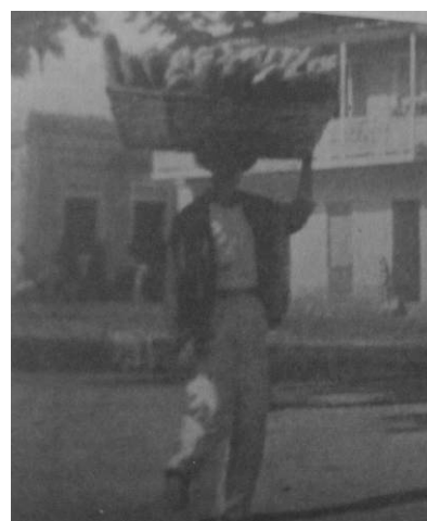
5. "Bread Wagon"

La espectacularidad es el matiz impreso por el cronista al ritual alimentario de los puertorriqueños. Así como la incongruencia en la decoración lo impacta al punto de suscitarle, como dijera Dinwiddie, "una impresión de horror", aquí la crispación se apresura ante la disposición inapropiada y el carácter antinatural de los alimentos. La movilidad de la escena, lograda por el uso del presente, de verbos y sustantivos indicadores de avance y ordenamiento, se transforma en dinámica sin concierto por impulso del calificativo que instala, desde la negación, la rutina normada y conveniente de la dieta del observador.