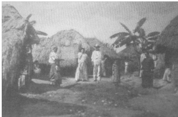
2. “Aldea de peones en Caguas”

Las paredes están empapeladas, no con decoraciones pero sí con utensilios de comida hechos corrientemente de calabazas. La comida se hace afuera de las casas [...] sobre una lámina de acero o en una pequeña cacerola y los alimentos son servidos en calabazas almacenadas y comidos con cucharas de calabazas. (Dinwiddie 1899: 160-162).