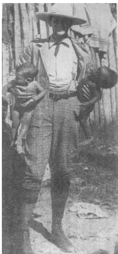
9. Walter Townsend, fotógrafo de Our Island and Their People

La pose desperdiga a hombres, niños y mujeres (imagen 2). La perspectiva distante acentúa la fragmentación del grupo y destaca, casi en perfecto semicírculo, la ausencia de lazos parentales precisos, excepto el que sugiere la débil proximidad de las figuras que ocupan el centro. No es difícil inferir la intencionalidad del cronista a través de las elecciones, en apariencia técnicas, de las que se vale para disponer y exhibir el objeto fotografiado. El desparramo de sujetos inscribe “una percepción cultural y una determinación ideológica” (Trachtenberg 1985: 188) en la que el desdibujamiento de parentescos graba los cuerpos de otros sentidos: los que exacerban lo pulsional.