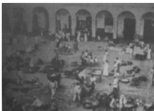
6. "Plaza del Mercado de San Juan"

Citando a Revel, Schavelzon recuerda que "ninguna gastronomía es inocente"; responde "a una realidad social, a la historia de una sociedad determinada en un momento determinado" y aun "la elección de los alimentos y su forma de preparación es también respuesta a una historia" (2002). Nada más lejos de esta perspectiva que la asumida por el viajero a la hora de informar sobre los platos habituales en las mesas isleñas. Su mirada se tiende oblicuamente sobre ellos sin reparar en las variables históricas y sociales ni en los productos naturales del suelo tropical que consolidaron hábitos de alimentación, modos de cocción y sazónamiento. Fiel a la observancia de sus