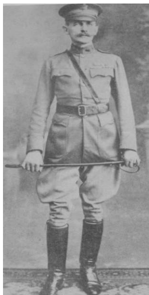
7. Coronel Bailey Ashford, cuerpo médico del ejército de Estados Unidos

Los ojos de Bailey Ashford no se dirigen a la cámara. 11 El giro leve del rostro abre el radio de la mirada y la proyecta en sesgo hacia delante, insinuando la existencia de un horizonte lejano, abierto. Las fotos del coronel del cuerpo médico del Ejército de los Estados Unidos dejan entrever los vínculos entre ciencia y poder imperial, y nos introducen en la trama donde aquellos cuerpos agredidos por el descontrol alimentario cobran otras significaciones a la luz del programa colonizador.