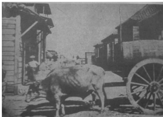
4. "Arecibo Water Supply"

Igualmente proclives a la erradicación por obra del "sentido suplementario" (Barthes 1986) que despuntan, las escenas de peleas de gallos, medios de transporte rudimentarios, instrumentos rústicos del trabajo agrícola, el garrote vil, bueyes acarreado agua (imagen 4), figuras de vendedores ambulantes (imagen 5) y animosos mercados (imagen 6) fecundan otros pliegues de la colonia. Tras la pátina del imaginario picturesque que aventan, satisfaciendo la demanda de lectores deseosos de novedad y exotismo, ellas detentan la vigencia de prácticas y modos arcaicos de comercialización y, con ellos, las