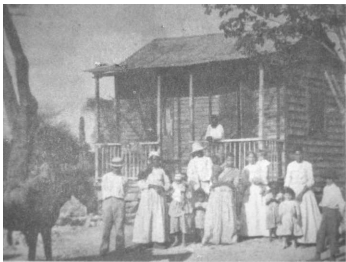
10. “Familia extendida campesina”

La censura aplicada a la vida licenciosa se recrudece ante la profusión de niños en las casas campesinas (imagen 10). Entonces asoman otra vez el espanto y la sorpresa, ahora enlazando la descripción con formas propias del relato no exentas de impulso moralizante. 13 Si bien la mirada es el dispositivo a través del cual se recobra la escena, la intervención de ciertos matices narrativos instaurados por formas verbales connotadoras de progresión y dilación temporal, y la aglomeración y el exceso traídos por la repetición y el desequilibrio entre hombres y mujeres dotan de fuerza argumentativa al pasaje y subrayan las propiedades que atentan contra la mentalidad funcional de la cronista: la falta de uno de los valores asociados con los sistemas modernos de regulación social —el aprendizaje del control de la natalidad— y su consecuencia indeseada —el crecimiento indiscriminado del cuerpo social. La desnudez se torna nuclear en esta percepción del desenfreno de las pasiones de los cuerpos: “Las jíbaras haraganean en la puerta con una sola y delgada prenda sobre ellas, tan desprendida y abierta como para exponer una parte importante de sus anatomías; el resto es visible a través de la transparencia del vestido.” (Hamm 1899: 84).