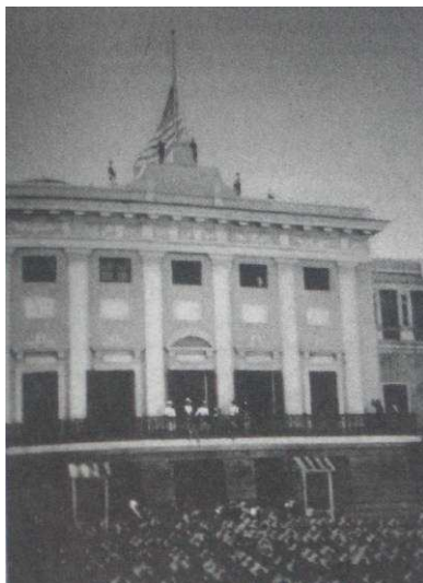
1. “Raising the American flag”

Cientos de máquinas fotográficas capturaron el instante que habría de convertirse en una de las imágenes más potentes del cambio de dominación de Puerto Rico en 1898: la bandera multiestrellada flameando en el mástil de la fortaleza frente a la plaza del Viejo San Juan, ante una multitud que observa —en posición solemne— el acto de entrega de la isla (imagen 1).